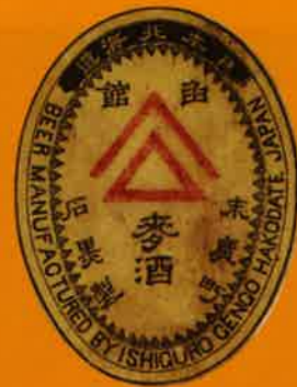
函館ビール(山崎麦酒)のラベル 1882年頃 サッポロビール博物館蔵