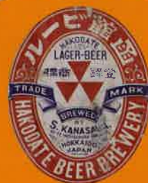
函館ビールのラベル 1897年頃 サッポロビール博物館蔵